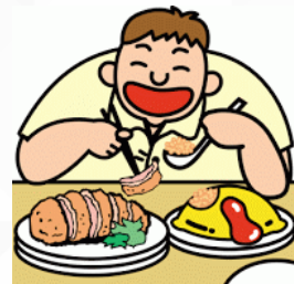
Kebiasaan makan berlemak dan kegemukan