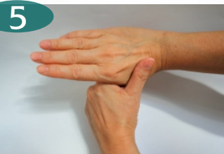
Gosok dan putar kedua ibu jari bergantian