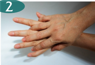
Gosok punggung tangan dan sela-sela jari bergantian