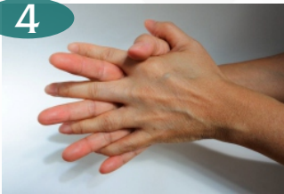
Gosok sela-sela jari hingga bersih